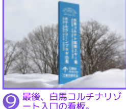
⑨ 最後、白馬コルチナリゾート入口の看板。

※わらび平看板⑧は左折せずそのまま道なりにお進み下さい。この他分からない点がございましたらホテルまでご連絡下さい。